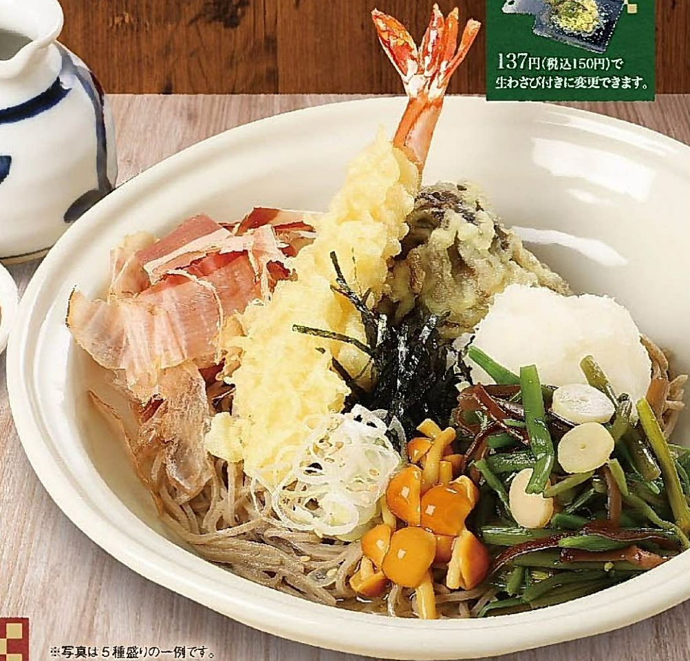
※写真は5種盛りの一例です。