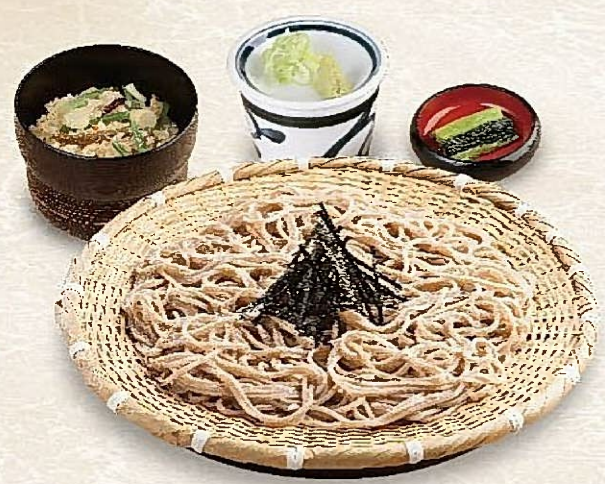
ざるそば定食 ・山菜かやくご飯・野沢菜付 〈生わさび1本付〉 928円(税込1,020円) 〈おろしわさび付〉 791円(税込870円)