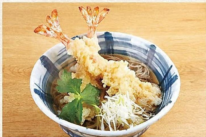
天ぷらそば【上】 1,164円(税込1,280円)