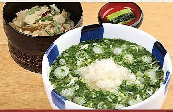
温ねぎみぞれそば定食 ・山菜かやくご飯・野沢菜付 937円(税込1,030円)