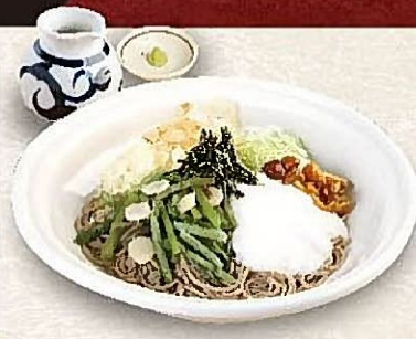
冷し山菜とろろそば

※器は店舗により異なる場合がございます。※時期により大海老の大きさが若干異なる場合がございます。