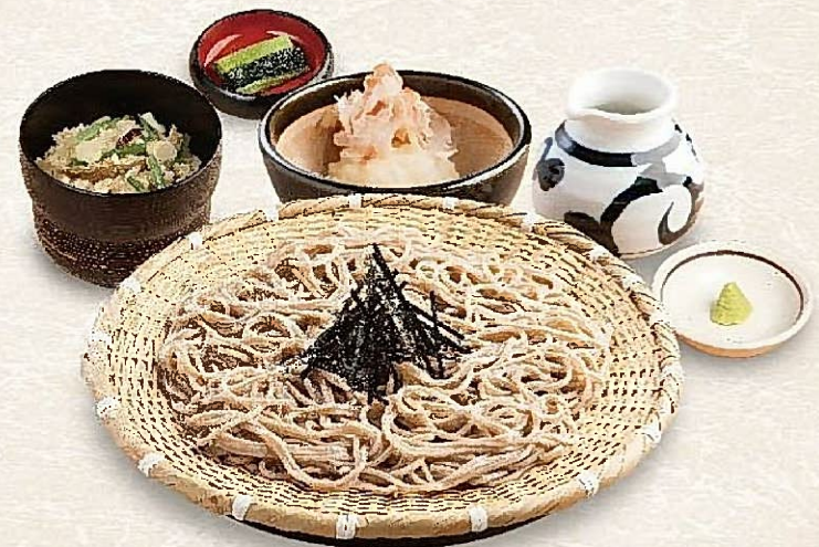
おろしざるそば定食 ・山菜かやくご飯・野沢菜付 〈生わさび1本付〉 973円(税込1,070円) 〈おろしわさび付〉 837円(税込920円)