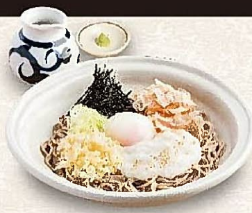
冷し月見山かけそば