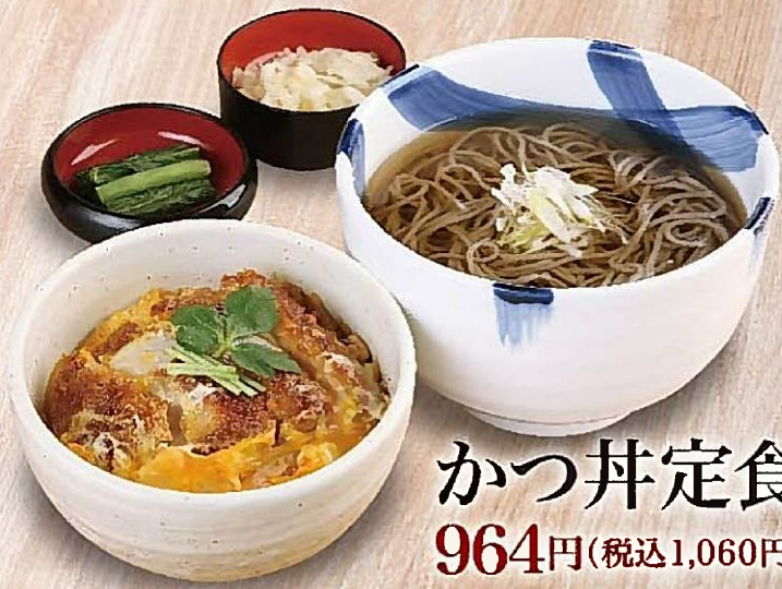
かつ丼定食 964円(税込1,060円)