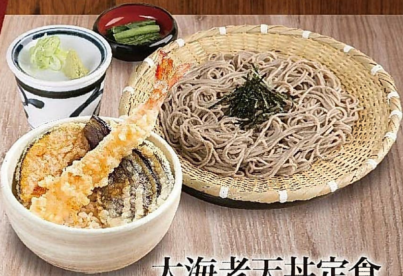
大海老天丼定食 1,046円(税込1,150円) 〈温そば〉〈冷そば〉お選びいただけます。