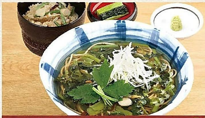
温葉わさびそば定食 ・山菜かやくご飯・野沢菜付 937円(税込1,030円)