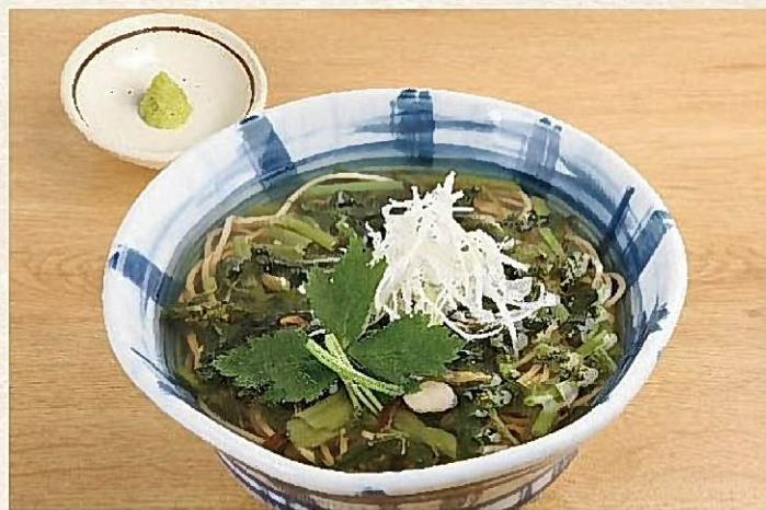
葉わさびそば 810円(税込890円)